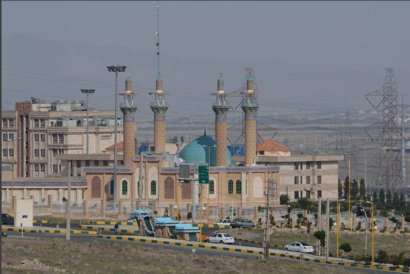
بلوار انقلاب اسلامی جنب مسجد وارضی دانشگاه آزاد اسلامی پرند واقع در فاز صفر