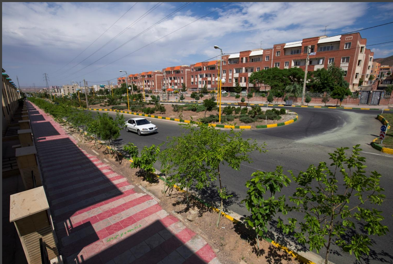
بلوار چهارباغ امام خمینی واقع در فاز ۱