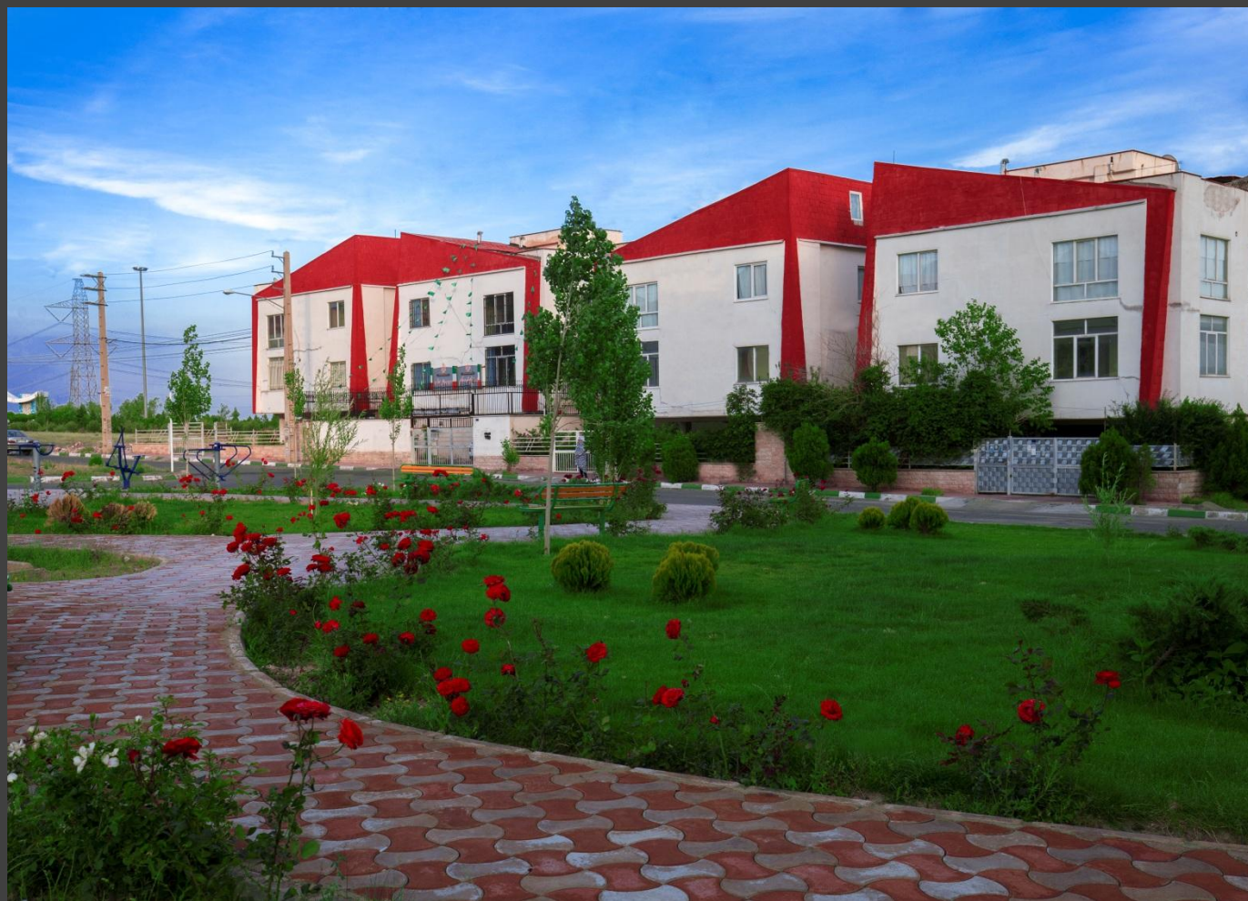
محللات مسکونی واقع در فازہ (گرانیت پی)