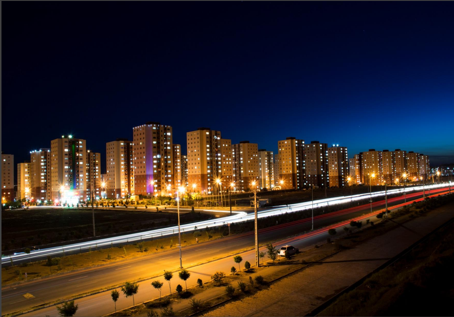
نمای در شب از شهری آفتاب (مسکن مهر) بربلوار مجهز شهری